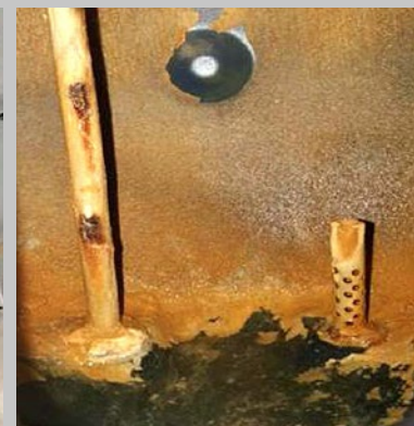
图6和7. 在沃肯(Vulcan)安装后十二周, 水垢已经完全消失。