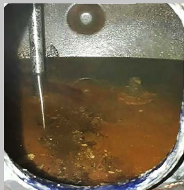
图4和5. 在沃肯(Vulcan)安装后三周, 初步的水垢已经消失。