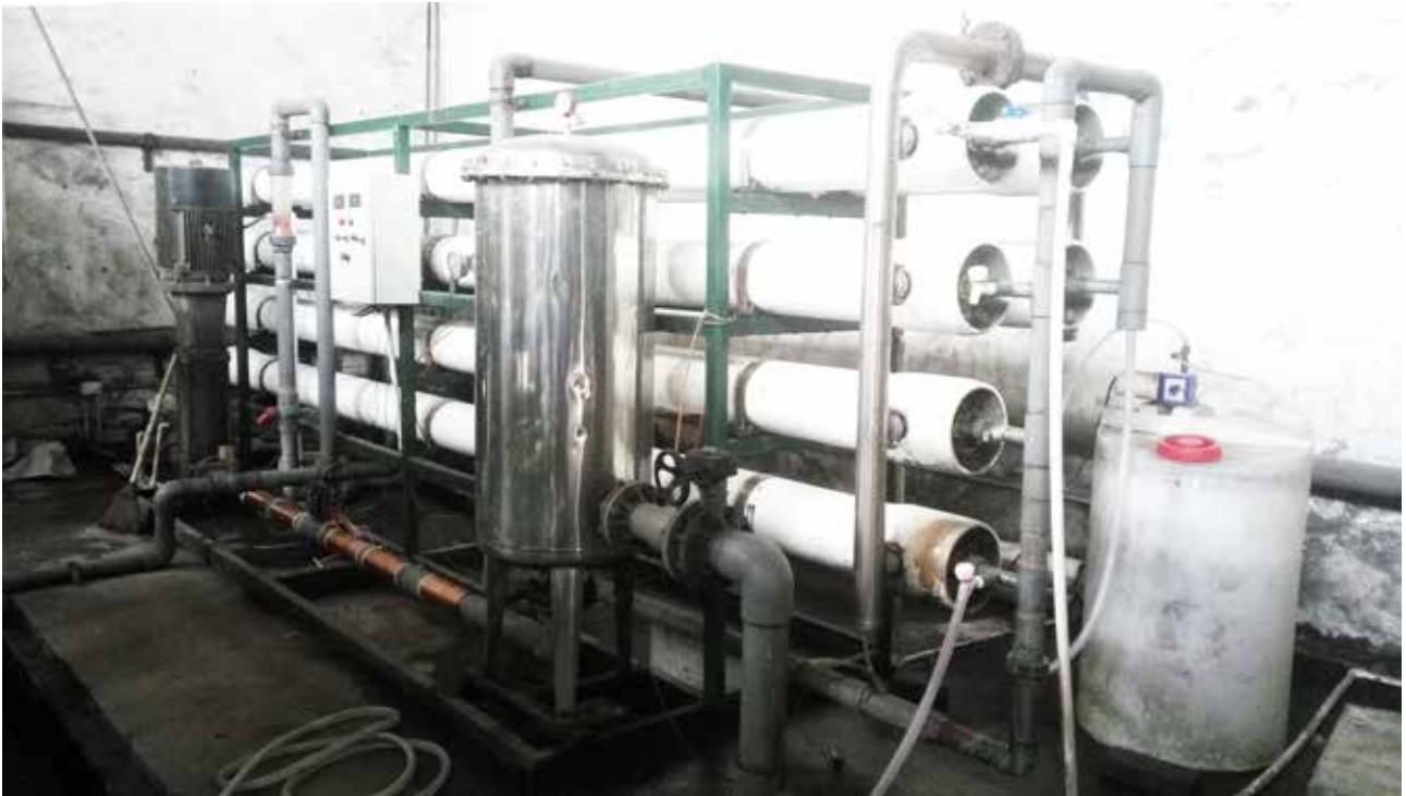
安装在反渗透膜入水处的Vulcan S100