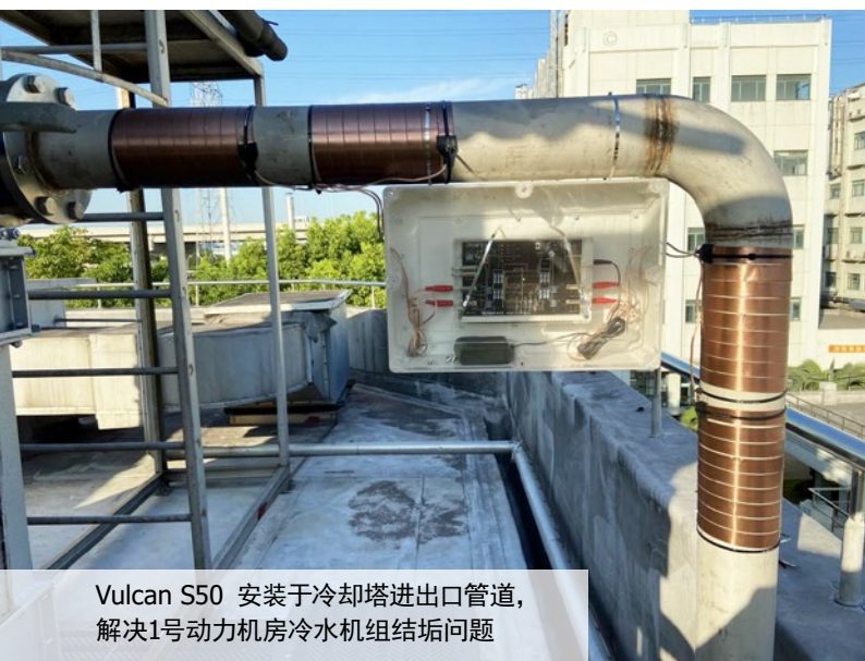
Vulcan S50 安装于冷却塔进出口管道，解决1号动力机房冷水机组结垢问题