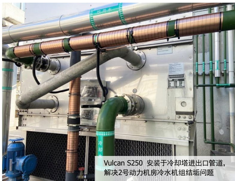
Vulcan S250 安装于冷却塔进出口管道，解决2号动力机房冷水机组结垢问题