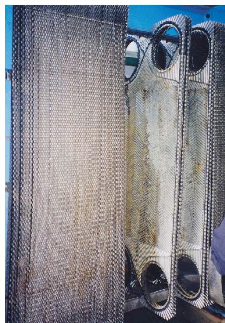
冷却塔蜂窝填充的控制