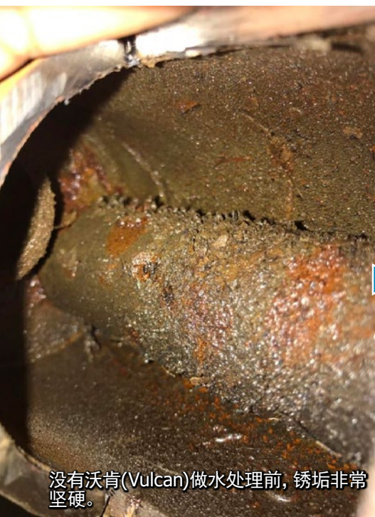
没有沃肯(Vulcan)做水处理前，锈垢非常坚硬。