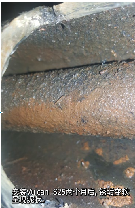
安装Vulcan S25两个月后，锈垢变软呈现泥状。