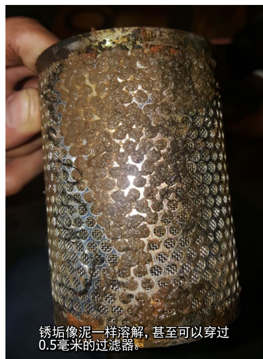
锈垢像泥一样溶解，甚至可以穿过0.5毫米的过滤器。