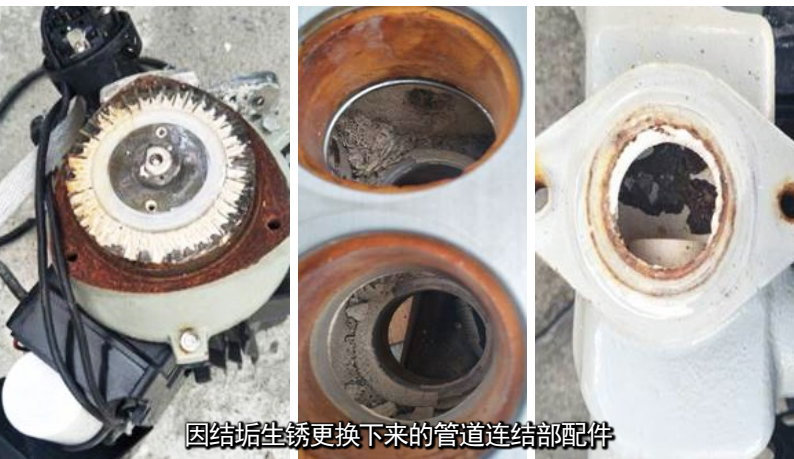
因结垢生锈更换下来的管道连结部配件

2017年4月安装6吨管式太阳能热水系统，在没有做任何水处理下，截止2018年5月，因系统结垢严重，已做人工除垢和系统维护三次，必须更换部分配件，包括太阳能玻璃管、联箱、阀门、水泵等，损失较大。