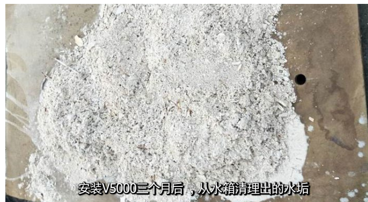
安装V5000三个月后，从水箱清理出的水垢

3. 安装三个月后，热水箱做了一次大清理，系统中水垢流回到水箱，清理出大量水垢，下图是从水箱清理出的水垢。太阳能系统的换热效率有显着提升，几乎维持在安装初期的效能。