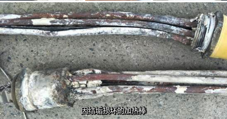
因结垢损坏的加热棒