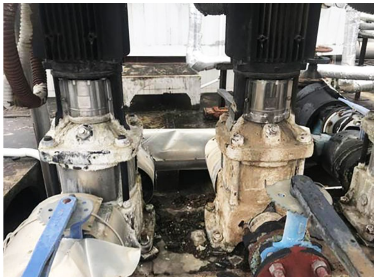
左边是安装Vulcan S25 二个月后的管道(无水垢)，右边则未做水处理