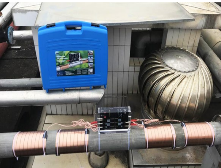
Vulcan S25 安装在B座客房整幢用水管道

昆明官房集团旗下共有5家五星级酒店，因为红河官房大酒店的试用成功，官房集团董事会已经决定旗下所有酒店，只要存在水垢问题，都将使用沃肯(Vulcan)电脉冲系统。