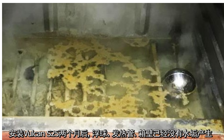
安装Vulcan S25两个月后, 浮球、发热管、箱壁已经没有任何水垢产生