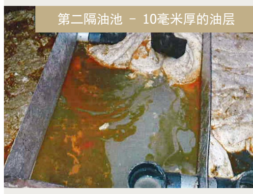
第二隔油池 - 10毫米厚的油层