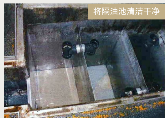
将隔油池清洁干净