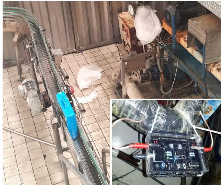
Vulcan 5000 安装在水循环室的进水口