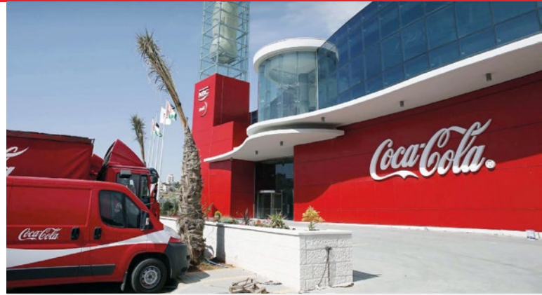
位在摩洛哥马拉喀什的可口可乐工厂