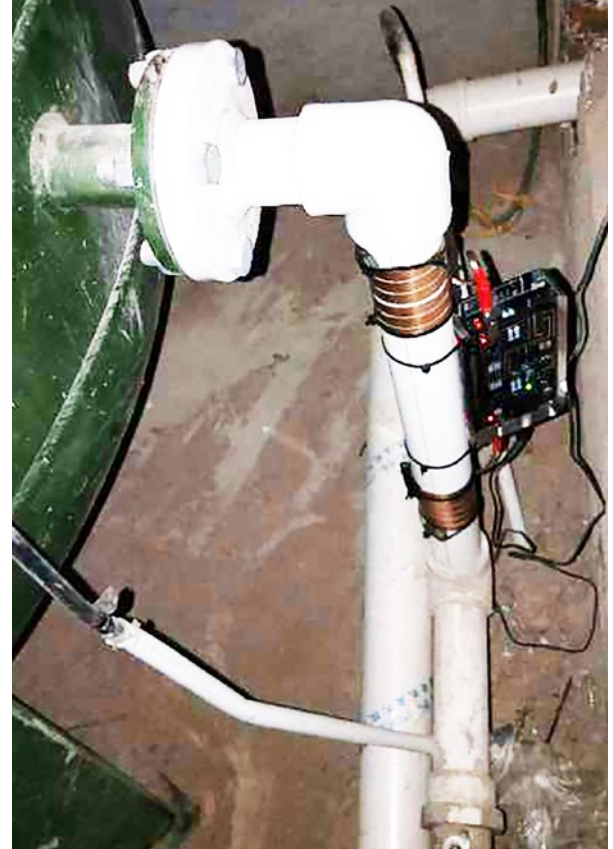
Vulcan 5000安装在洗浴中心压力罐总出水口处

安丘碧海云天洗浴中心简介 坐落于山东省潍坊市南花园，内有客房30间；男/女洗浴各一间，并且男洗浴间内有浴池。