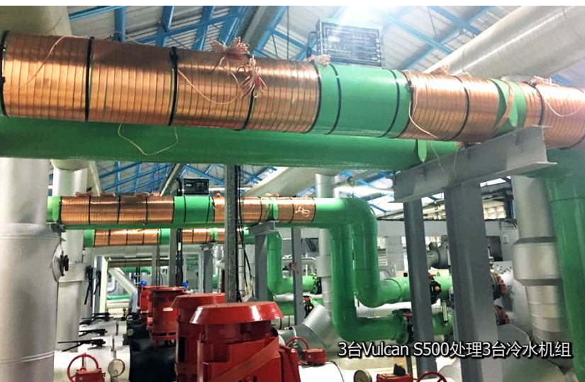
3台Vulcan S500处理3台冷水机组

该酒店维修经理甚至也批准了在牙买加的仑大白沙度假村 (Royalton White Sands) 最新 Vulcan S250 的试验装置。我们将继续在未来的演讲中使用 Barceló Bávaro 皇宫酒店的成功案例。