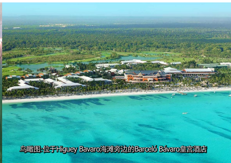
鸟瞰图:位于Higüey Bavaro海滩旁边的Barceló Bávaro皇宫酒店