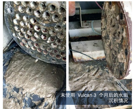
未使用 Vulcan 3 个月后的水垢沉积情况