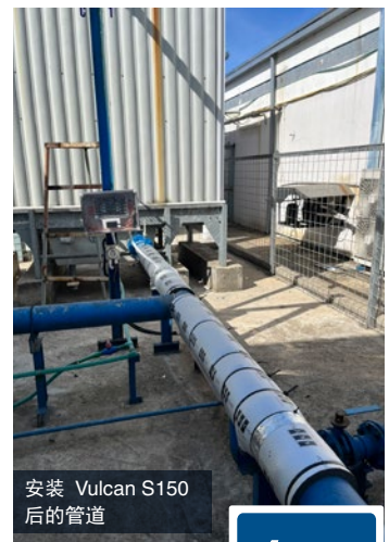
安装 Vulcan S150 后的管道