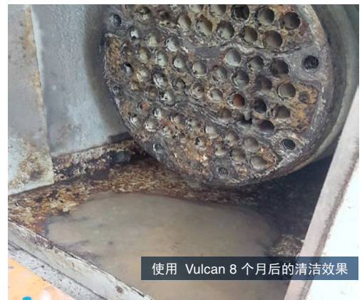
使用 Vulcan 8 个月后的清洁效果